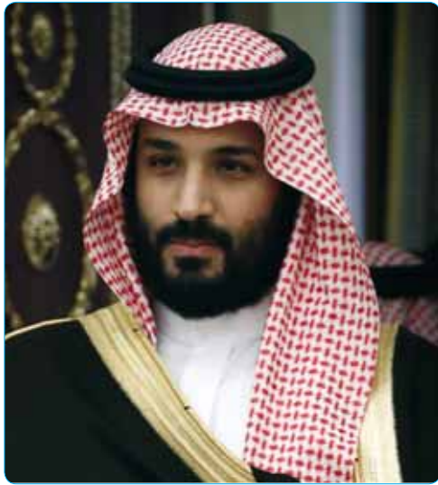
السابع من ربيع الآخر ١٤٤٠ هـ

إن هذه المفاوضات جاءت في الوقت الذي يتصارع فيه في اليمن عملاء بريطانيا "حكومة هادي" وعملاء أمريكا "الحوثيون" على تقاسم الحصص الكبرى من خيرات اليمن، وتمثل الجديدة في هذه المعادلة بيضة القبان، حيث إن الطرف الذي يسيطر عليها يعتبر صاحب النصيب الأكبر في الموارد المالية والسيطرة الاستراتيجية في أرض المعركة. ولنا أن نسأل، لماذا كانت كل هذه الحرب وكل هذه التكاليف التي تحملها أهل اليمن إذا ما كانت نهايتها تسليم بلادهم لأعدائهم؟! ولصالح من كانت الأدوات المحلية في اليمن يقتتلون فيما بينهم، ويقتلون أهل اليمن إذا ما كانت القضية تحل في دهاليز سياسة الأمم المتحدة؟ وهل فعلاً كان لا بد لهذه الحرب أن تكون بين أبناء المسلمين خدمة لمصالح المستعمرين؟ لا شك أن إجابات هذه الأسئلة وغيرها صار واضحاً وبشكل كبير حتى لعامة الناس وخصوصاً في اليمن.