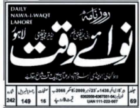
Nawa-e-Waqt 24 November 2009, back page (12)