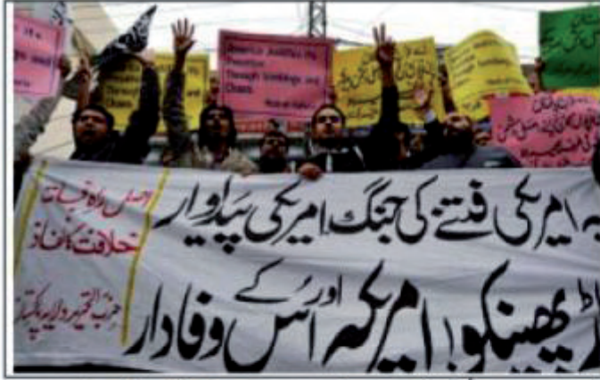
لاہور: کالعدم حزب التحریر کے ارکان احتجاجی مظاہرہ میں امریکہ کے خلاف نعرے لگا رہے ہیں