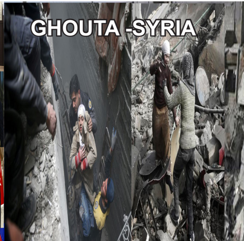
GHOUTA - SYRIA