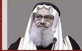
ŞEYH YUSUF MUHAREZEH