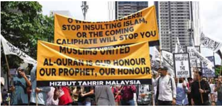
Şebab, Cuma Namazının ardından Hollanda Büyükelçiliğine yürüyor.